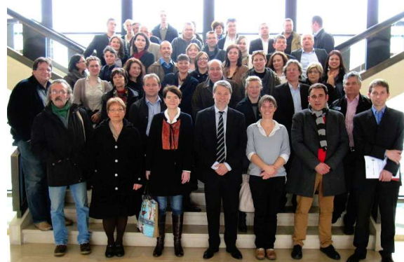
Senior academy parrainée par Daher, Elengy et Silène