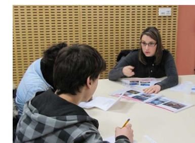
Collège Jean Moulin