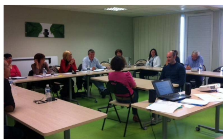
Sensibilisation à la diversité des managers de la CNIEG

sensibilisation à la diversité ( CNIEG, Ecole Centrale Nantes, Geiq Propreté, SSIO... ), obtention du label diversité , accompagnement des entreprises dans un plan d'égalité de traitement, pré recrutements de public prioritaire, petits déjeuners au cours desquels les bonnes pratiques d'entreprise sont essaimées etc.