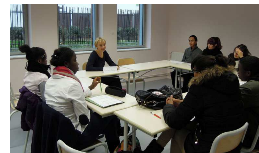
Collège Sophie Germain