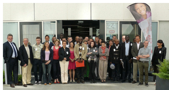
Job academy parrainée par Quille Construction